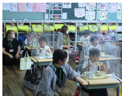
【1年生】6月30日 「給食試食会」…子どもたちの給食の様子の参観、試食会&食育講話をしました。