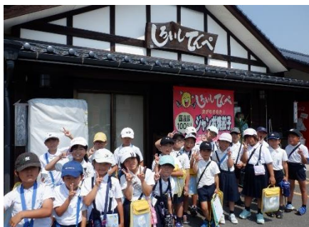
【2年生】6月21日 「レッツゴー 町たんけん！」 みんなで町探検に行きました！