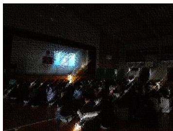
絵本『わた しのいもう と』読み聞 かせと先生 の話