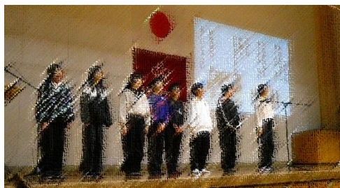
大山委員会 による人権 の詩の朗読

12月2日には、全校で人権集会を行いました。事前に各学級で人権に関する授業を行い、みんなが人権を大切にしながら、安心して生活できるようにするために必要な事を考えました。そして、各学級の『人権宣言』を決め、集会で発表しました。