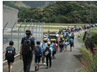
【中央運動公園へ、しゅっぱ〜つ！】