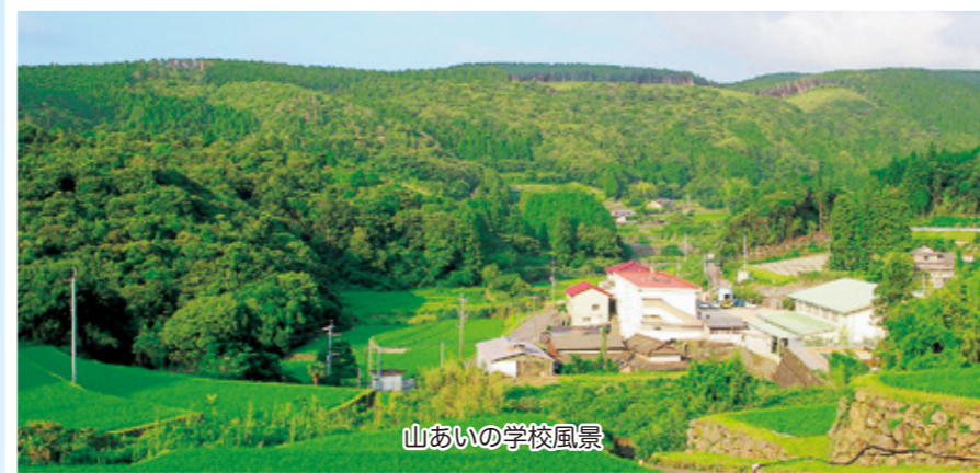
山あいの学校風景