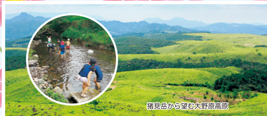
猪見岳から望む大野原高原