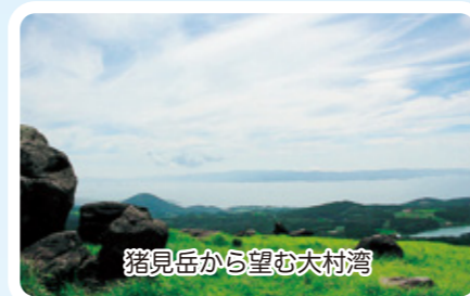
猪見岳から望む大村湾