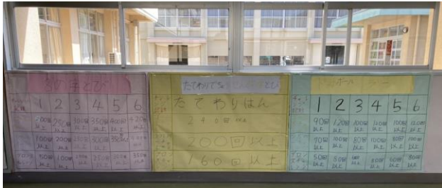
👉①掲示物（達成賞基準一覧表児童作成） 鹿島市立七浦小学校