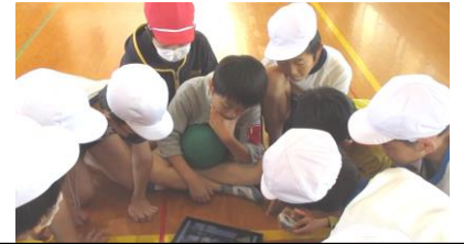
👉③ICTの活用（撮影後作戦会議） 武雄市立御船が丘小学校