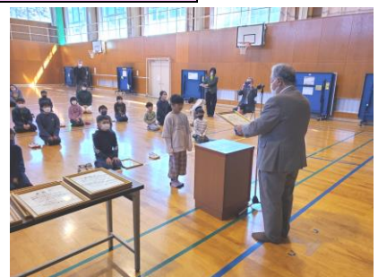
※各学校にて（2/21, 22, 27） 奨励賞等の表彰の様子

※県庁1階県民ホールにて（令和5年2月10日）。同時に行った食育推進優良校（上峰小学校・牛津高等学校）も含む