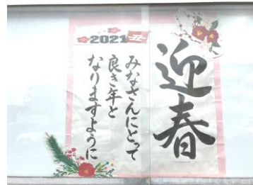
【屋外学校掲示板より】

積雪により4日遅れの12日（火）に3学期の始業式を放送にて実施しました。まずは冬休み中、大きな事故や問題もなく、無事に全校生徒のみなさんが過ごせたことに安堵したところです。しかし、コロナ禍で、不要不急の外出を控えるなど、例年のお正月とは違う我慢の年始だったのではないのでしょうか。始業式では、新型コロナウイルスの感染が全国的に拡大し、佐賀県や唐津市においても予断を許さない状況にあり、家庭内での感染リスクが高まっていることを伝え、学校でも感染症対策をしっかり継続・強化しながら、緊張感を持った身構えでマスク着用は100%を徹底することを確認しました。3年生は、「それぞれの進路目標の実現に向けて、残された日々を充実させてほしい」・2年生は、「学校行事や生徒会活動、部活動で学校の中心を担うことになる」・1年生は、「中堅学年への自覚と実力を培う時期になる」と、それぞれの学年に応じた目標をもって、何事にもしっかり取り組み成長して欲しいと話しました。丑年は、「我慢（耐える）」や「物事が発展する前ぶれ（芽が出る）」を表す年になると言われています。新型コロナウイルスの感染拡大で、まだまだ耐え忍ぶ年になるかもしれませんが、地道に突き進むことで新たな発展へと繋げる年にしたいものです。私達職員も「日々新たなり」の精神で、日々の教育活動に誠心誠意取り組んでいきたいと思っております。保護者の皆様、地域の皆様、本年もご協力とご支援の程をよろしくお願い致します。