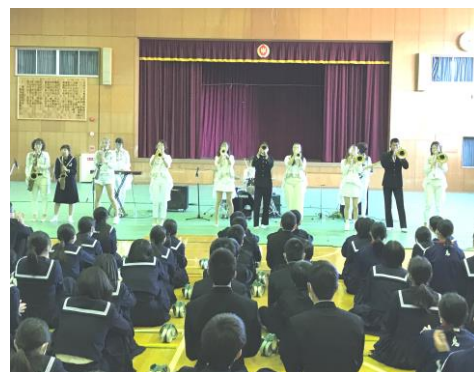
【3名の生徒が楽器を体験】

11月11日（水）「ブラス・スクール・パーティー2020」In佐賀と題した芸術鑑賞会を3年生を対象に開催しました。東京ブラススタイルというブラス・ユニットが来校し、楽器の体験を交えたスクールコンサートで楽しい時間を過ごしました。東京ブラススタイルは、2005年に結成され、2007年8月に、アルバム「ブラス天国」でメジャー・デビュー。バラエティーに富んだ斬新なブラス・アレンジと圧倒的なパフォーマンスで、国民的アニメ・ソングの名曲を永遠の名作として生まれ変わらせるユニットです。当日は、ドラゴンボール・ルパン三世・鬼滅の刃・魔女の宅急便等のアニメ・ソングを披露していただきました。