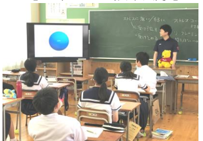
【2年生での授業風景】