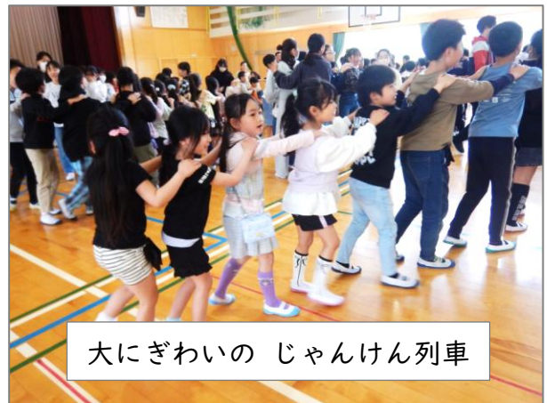
大にぎわいの じゃんけん列車

じゃんけん列車は全校入り混じっての生き残りゲーム。負けたほうが勝ったほうの後ろにつながります。こうした「ふれあい」を通して、 いっそう心の距離も縮まったのではないのでしょうか。 あらためて、異学年交流のよさを感じる一日となりました。