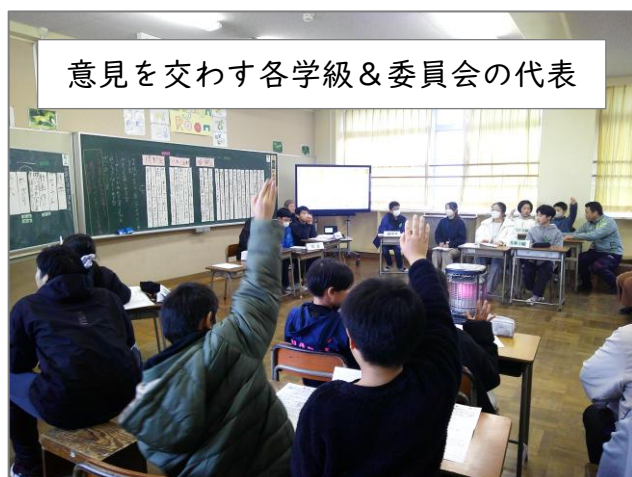
意見を交わす各学級＆委員会の代表

必要な係については、各学級で話し合ってきた案を出し合い、 やりたい思いを主張しながら、あるいは譲ったり合体案で折り合いをつけたりしながら、無事担当を決めることができました。 しっかりと意思表示ができる学級・委員会の代表が、とても頼もしく見えました。