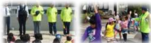
交通安全指導・あいさつ運動