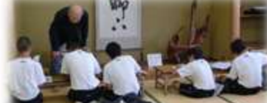
放課後等補充学習支援