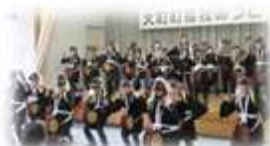
児童生徒の地域貢献