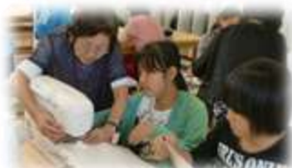
家庭科学学習支援