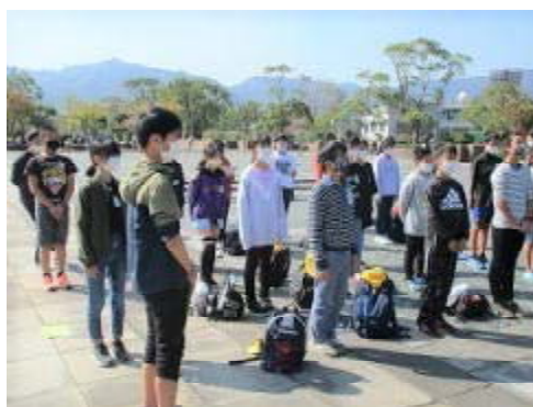
6年生 平和公園での平和集会