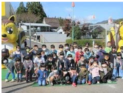
1, 2年生 メルヘン村にて

保護者の皆様には、事前の健康管理や当日の持ち物、お弁当の準備等でご協力をいただきました。本当にありがとうございました。