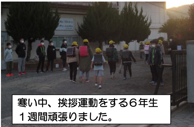
寒い中、挨拶運動をする6年生 1週間頑張りました。

6年生は、卒業を前に朝の校門での挨拶運動や下級生との昼休みの交流、登校時の清掃活動など、様々な取り組みをしています。思い出作りだけでなく、自分たちがお世話になった通学路や学校をきれいにして卒業したいという感謝の気持ちを表す姿が、とてもうれしく頼もしく感じます。思いのこもった6年生の一つ一つの活動が、下級生の手本となり大川内小学校に受け継がれていきます。