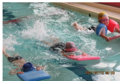
低学年は小プールで楽しく