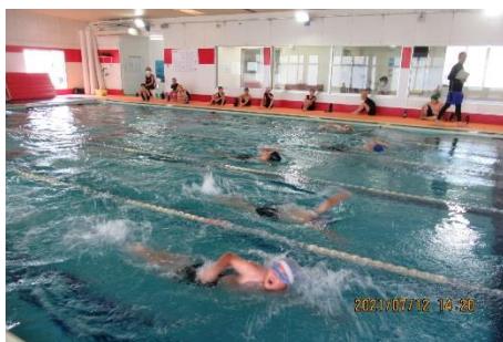
上学年：25mタイムレース

低学年は、大プールでの25m、12m、小プールでの12mの中から一つ選び、クロールやバタ足に挑戦し、いるか・アザラシリレーや宝探しも楽しみました。中学年は、おみこしリレーを楽しんだ後、自分ができるようになった泳ぎで、25mや15mに挑戦しました。高学年は、クロールや平泳ぎで距離に挑戦したりクロールで25mのタイムに挑戦したりしました。水泳授業が始まって、一月ほど経ちます。どの学年もプール開きを入れると7時間練習を重ねてきました。低学年は十分に水に親しみ、中学年と高学年は、力強い泳ぎができるようになり、個々の目標を達成していました。