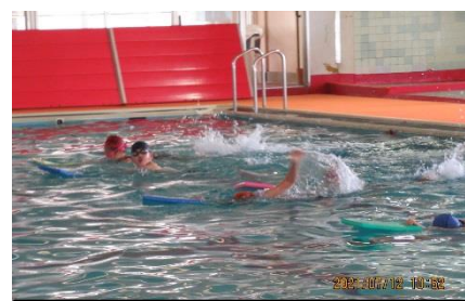
中学年：25m完泳をめざして