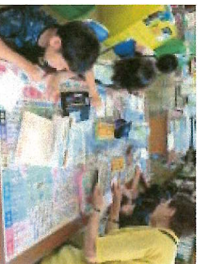
身近の物を題材にして