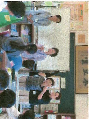
「大川町絵手紙愛好会」の方たちです

8月28日(月)・29日(火)に1年、2年、6年の絵手紙教室が開かれました。これは、方川町の「子ども本立塾」の取組として行われ、当日は「大川町絵手紙愛好会」の方の指導に来ていただきました。子どもたちは、愛好会の説明を受けながら、身近な物を題材にして、上手に絵手紙を仕上げました。