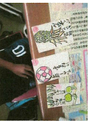
上手にかくことができました