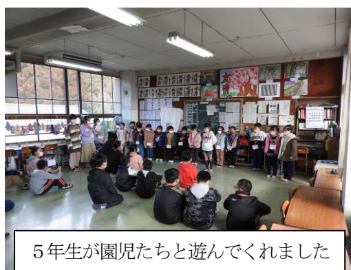
5年生が園児たちと遊んでくれました