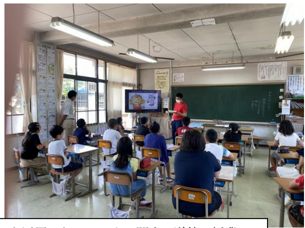
「伊万里っ子応援プログラム」を活用した、コロナに関する道徳の授業