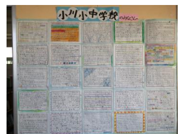
呼子小4年生からのメッセージ

10月26日(木)に呼子小4年生と小川小3,4年生との海洋交流学習が行われました。小4の●●●●さんと小3の●●●●さんが堂々と話す姿や表情を見て、学校に戻った呼子小の児童たちは「発表上手だったね」と友だち同士で話していたそうです。呼子小のみなさんから海洋交流学習のアンケートと感想をいただき、私も読ませてもらいました。これからクジラについて学習したことを新聞にまとめたり、全校児童に向けて発表するための資料をつくったりしていくそうです。