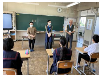
中学生対象出前授業の様子

10月16日(月)に中学生を対象にした出前授業があり、呼子公民館と近代図書館から計6名の職員の方に講師として来校していただきました。内容は、近代図書館からは本の読み聞かせや紹介と呼子公民館館長さんによる大喜利大会でした。テストを受けたあとの授業で生徒たちにとってもリフレッシュできる良い機会となりました。6名の講師のみなさん、ありがとうございました。