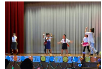
小1~4による「♪アイドル」

オープニングの「千本桜」の演奏を皮切りに、「守ろう！小川島」や「島人ぬ宝」「小川島唄」の歌が披露されました。どの歌やダンスもとても上手でした。最後の「小川島唄」は、職員も児童生徒の列に加わりみんなで歌いました。