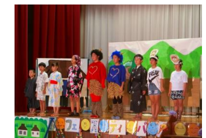
島っ子劇団「泣いた赤おに」

人間と友達になりたい「赤おに」と「赤おに」を応援する「青おに」の友情を「やさしい心を大切にする」島っ子劇団の小学生たちが熱演しました。