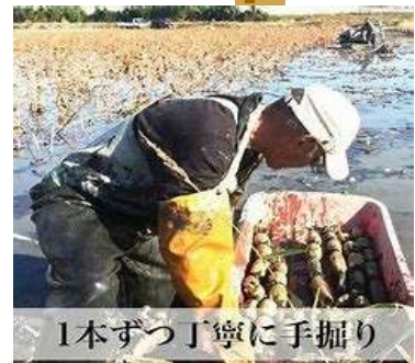
1本ずつ丁寧に手掘り