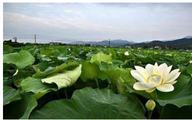
レンコン畑には、こんなきれいな花が咲きます。

コッペパン スパゲティミートソース フレンチサラダ 鶏肉のから揚げ バナナヨーグルト