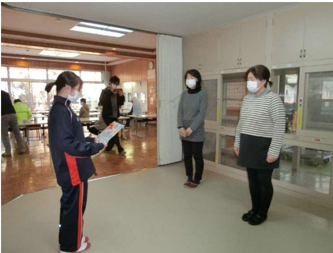
沙笑さんが代表で色紙をわたしました。

そこで給食を作っていたいただいている調理員さんに、みんなの感謝の気持ちをメッセージにし、色紙を送ることにしました。