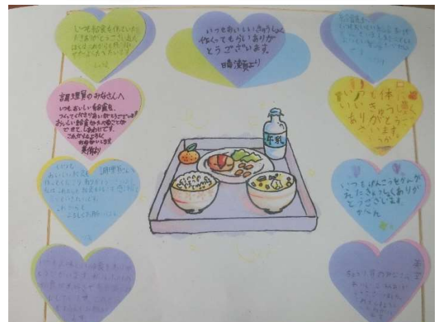
みなさんの感謝の かんしゃ ことばがつまっていました。