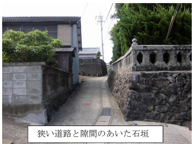
狭い道路と隙間のあいた石垣