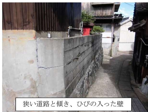
狭い道路と傾き、ひびの入った壁