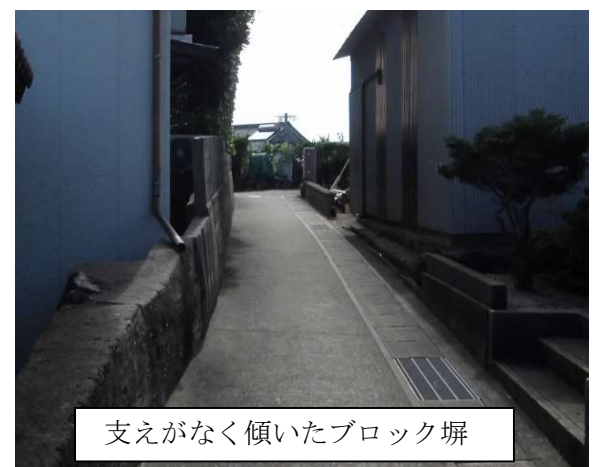
支えがなく傾いたブロック塀