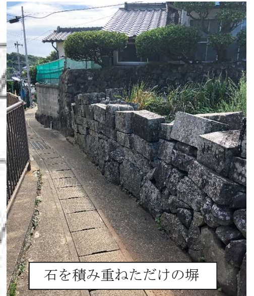
石を積み重ねただけの塀