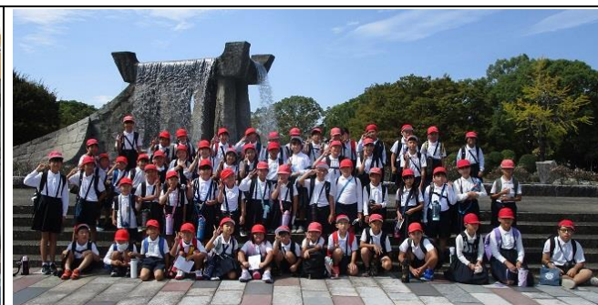
久留米市鳥類センター