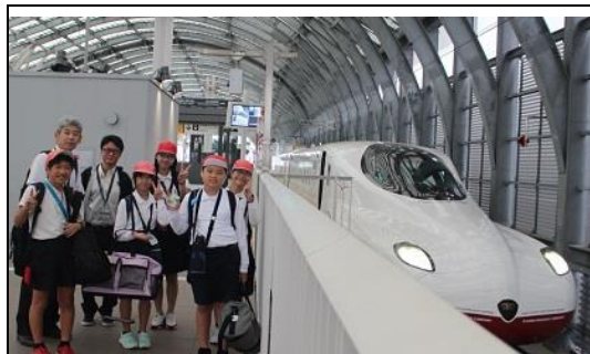
西九州新幹線に乗って長崎市へ