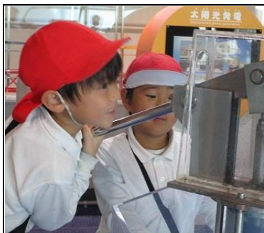
福岡県青少年科学館

青少年科学館では、科学の仕組みを利用した面白い実験や発電できる自転車など楽しい体験がたくさんできました。鳥類センターでは、フラミンゴやたくさんの種類の鳥を見ることができ、鮮やかな鳥の姿に子どもたちは驚いていました。おいしいお弁当にも大満足、1日しっかり楽しんでいる子どもたちの姿を見ることができました。バス旅行の準備やお弁当の用意をしていただいた保護者の皆様、ありがとうございました。