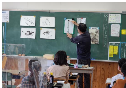
6年 室町体験 墨絵