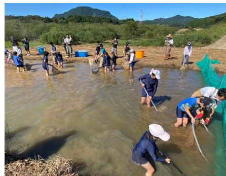
4年 アザメの瀬堤返し