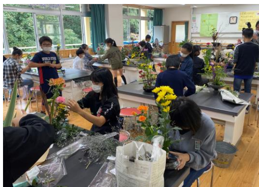
6年 室町体験 生け花