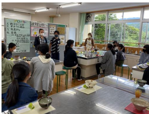
6年 室町体験 お茶会