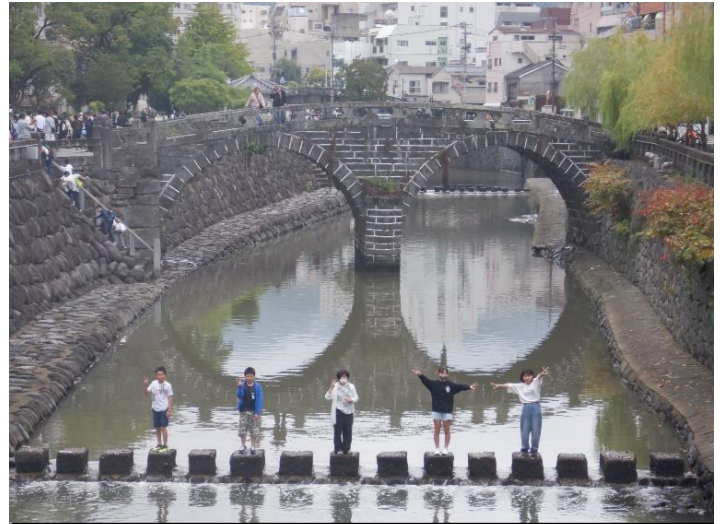
眼鏡橋を背に撮影。ちりんちりんアイスもおいしかったです。