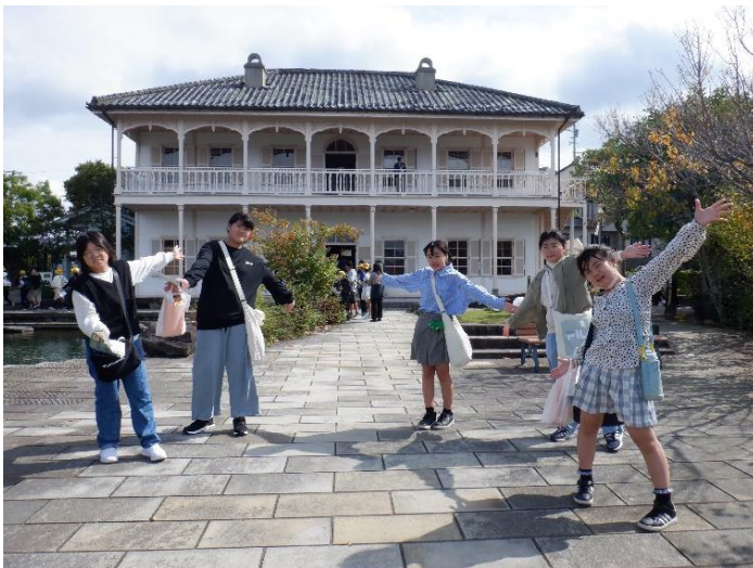
グラバー邸で国指定重要文化財に指定されている伝統的建造物を見学しました。