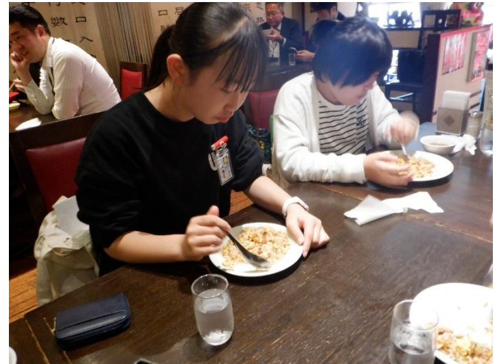
昼食は中華街で！おいしいお店を見つけられたようです。