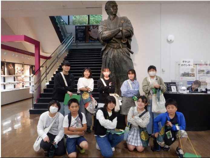
長崎歴史文化博物館から2日目のスタートです。班活動で長崎市街を遊学します。