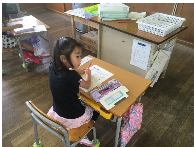
【1年生】朝のチャレンジタイムの問題を一生懸命頑張っていました。

2学期がスタートして1週間。夏休みからの気持ちの切り替えもスムーズにでき、子供達は落ち着いた態度で授業に臨んでいます。休み時間に子供達と話をすると、『〇〇に行ってきました』『お手伝いを毎日しました』など夏休みに体験したことをたくさん聞かせてくれました。