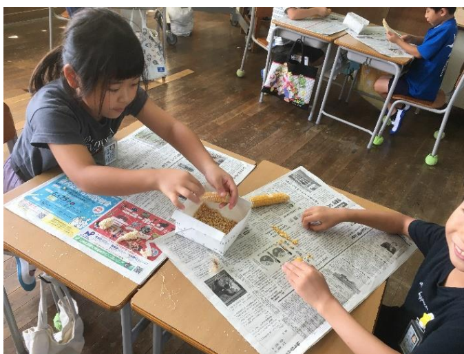
【2年生】ポップコーンを作るために育ててきたトウモロコシを一粒一粒丁寧にとっていました。