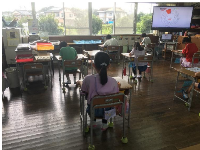
【3年生】テストに真剣に取り組んでいました。夏休み中の学習の成果が出せたでしょうか。