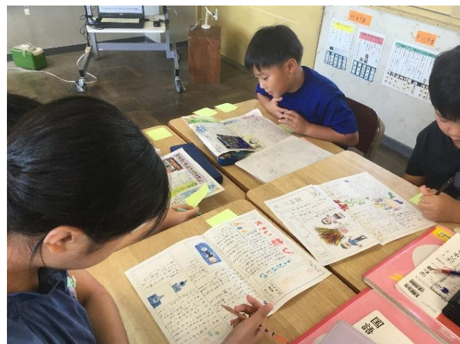
【4年生】夏休みの出来事を新聞にまとめ、国語科の授業の教材にして友達と交流学习を進めていました。