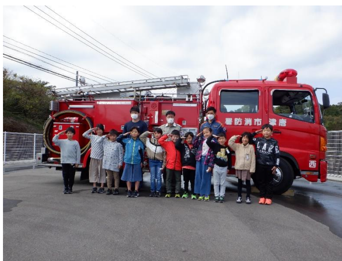
消防署（西部分署）にも行ってきました。救急車の中も見せていただきました。