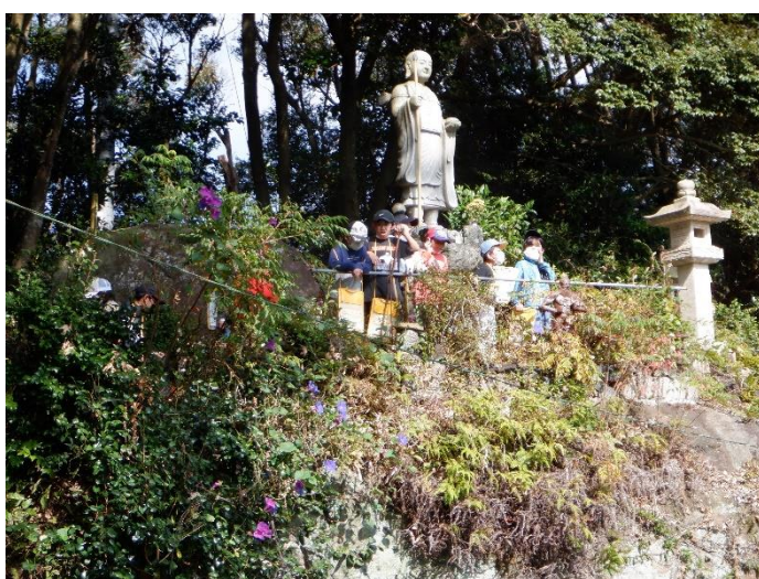
鶴の岩屋の洞窟の中には、約500年前に彫られたといわれるたくさんの仏像がありました。