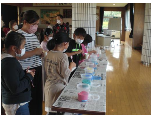
【3年生】波戸岬少年自然の家の方に来ていただき、グラスサンドアートにチャレンジしました。