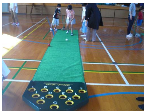
【2年生】穴に入れるのは難しそうでしたが、スカットボールで楽しみました。