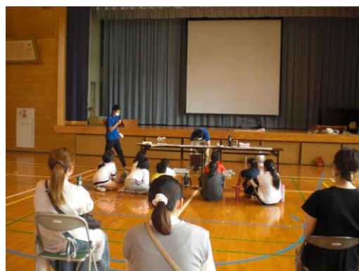
【4年生】県立宇宙科学館の方からいろいろな実験を体験させてもらいました。