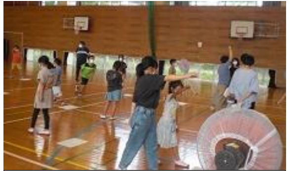
【応援リーダーの上級生が動きを教えています】

10月11日（月）に、赤白それぞれの応援団の結団式を行いました。応援リーダーが自己紹介と応援の“めあて”を伝えた後、早速、応援の練習が始まりました。2年ぶりの応援合戦で、コロナ禍での様々な制限がある中、応援の形を作っていくのは大変だと思いますが、応援リーダーは6年生を中心に工夫を凝らして頑張ってくれています。