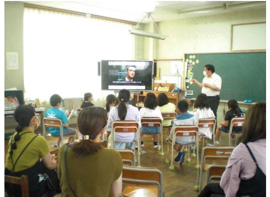
4年生はネット依存等について学習をしました

お子様の様子はいかがでしたか。新しい学年になって2か月余りとなりますが、成長した様子を見ていただけたと思います。授業で見ていただいたように、授業や活動ごとに「めあて」「かぜっこパワーの確認」→「まとめ」「ふりかえり」という流れを全学年で共有して取り組んでいます。この積み重ねで、毎時間力を付けています。学年末にはどのくらい成長した姿が見られるか楽しみです。