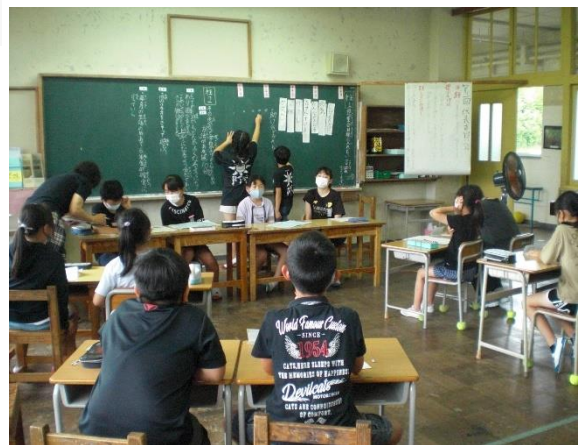
2~6年生・委員会の代表で話し合いました

6月16日(水)、今年度最初の代表委員会がありました。今回の議題は“児童会目標を考えよう”でした。各クラスの代表が、事前にクラスで話し合ってきた「児童会目標に入れたい言葉」をもとに、意見交換を行いました。“笑顔あふれる”“みんながんばり助け合う”などが出され、この会では決まりませんでした。企画実行委員会を中心に、これからよりよい目標が作られていきます。始業式で「納所がすき！学校がすき！とみんなが言える学校にしましょう。」と今年度の学校目標について、子供達に話をしましたが、様々な場面で、子供達も学校目標を意識して取り組みを行ってくれています。今年度の児童会目標がどのようなものに決まるか楽しみです。