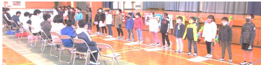
6年生へ呼びかけ(1年生・2年生)

6年生が中心となって進めてきた、児童朝会も委員会活動も5年生への引き継ぎが出来てきたようです。今回の児童朝会の進行も委員会の発表も、5年生を中心に行われました。