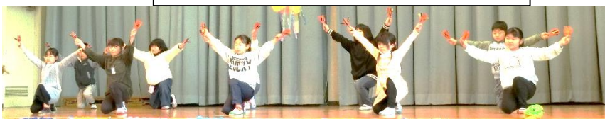
6年生からの直伝ソーラン(3年生)

は、下級生がそんな気持ちを持っているとは、あまり気づいていなかったかもしれません。でもこの1年を精一杯頑張ってきたことがみんなに認められたと感じたのではないのでしょうか。自分に自信を持ってこれからの生活を送ってほしいと思います。