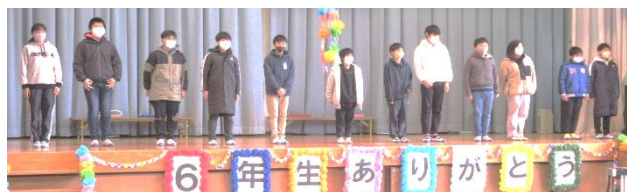
下級生へのメッセージ(6年)