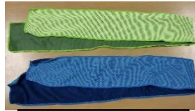
育友会から クールタオル

もうすぐ、暑さが増しそうな時期になりました。以前お知らせしていた、育友会より購入いただいた、クールタオルを子ども達に持たせようと準備をしています。唐津市教育委員会からもクールバンド（首に巻くもの）も届きました。洗い替えに使っていただきたいと思います。