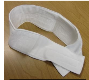
市教委から クールバンド

また、大型扇風機（羽直径45cm）も唐津市教育委員会より6台届きました。各学年で活用する予定です。物の準備はできましたが、猛暑日が続かないように願っています。