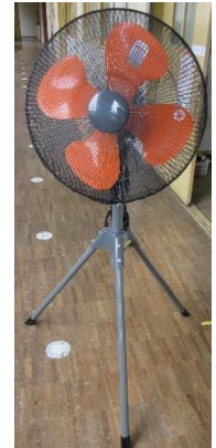
市教委から 大型扇風機

また、大型扇風機（羽直径45cm）も唐津市教育委員会より6台届きました。各学年で活用する予定です。物の準備はできましたが、猛暑日が続かないように願っています。