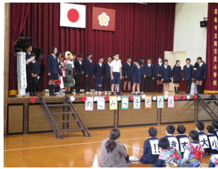
能古見でいちばんやかましい5-1：5年