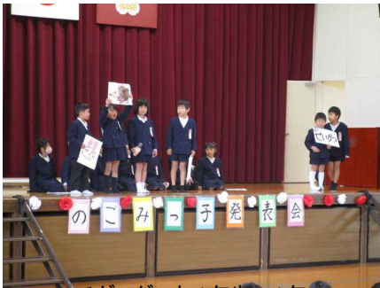
チグハグっと1年生：1年