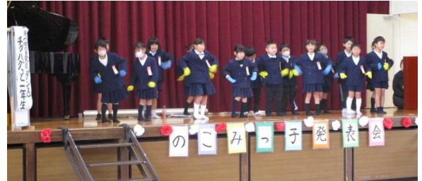
かわいいダンス：1年