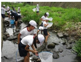
体験学習(生物調査)