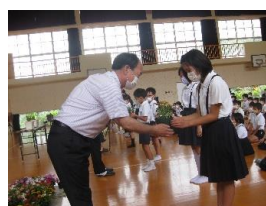
人権集会(人権の花運動)