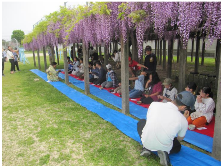
お茶をいただく6年生

と熱い思いを語られました。日新小学校は、地域の人たちに愛されている学校だとつくづく思います。今後もこの行事が、20年、30年と続いてほしいと思いました。