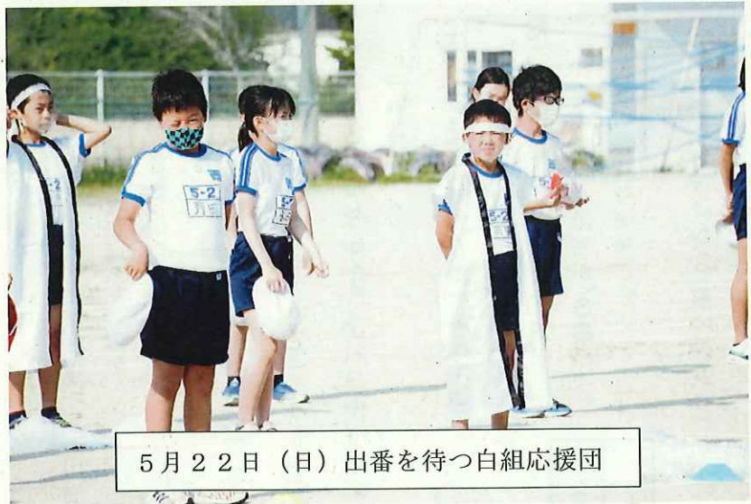
5月22日(日)出番を待つ白組応援団

私たち教職員の本務は、子供の教育に全力を注ぐことです。ホームページにかける時間があつたら、授業の準備とか、子供とのふれあいなどに時間を費やすべきだというご意見があるのは分かります。私どももそう思います。しかし、「超スマート社会“Society5.0”」と呼ばれる昨今、ホームページを通して情報を発信・共有することは、地域社会や保護者の皆様と適切な関係を持つ上では、大