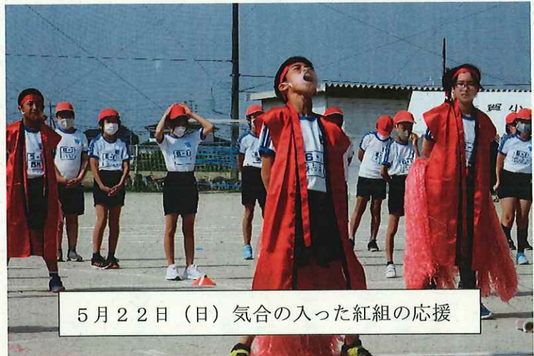
5月22日(日) 気合の入った紅組の応援

暑い中、コロナ禍で様々な制約がある中でしたが、子供たちはよく頑張っていましたね。もしかすると、いつも以上の力を発揮していたのかもしれませんが。全校児童が一堂に会することはありませんでしたが、全員で同じ目標に向かうことで、成長した部分が大きかったのではないかと自負しています。最後まで勝負の行方の分からないデッドヒートで、最終的には2点差で白組がかわりましたが、いい勝負でした。