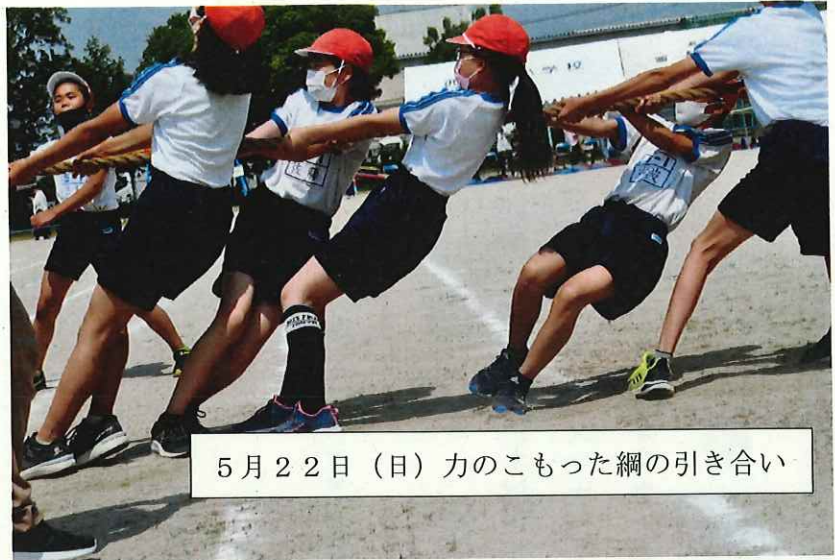
5月22日(日)力のこもった綱の引き合い

特に、6年生保護者様におかれましては、最後の団体競技・表現運動でしたので、大変申し訳なく思っております。子供の健康・安全を第一に考えての措置でしたので、何とぞご容赦下さい。