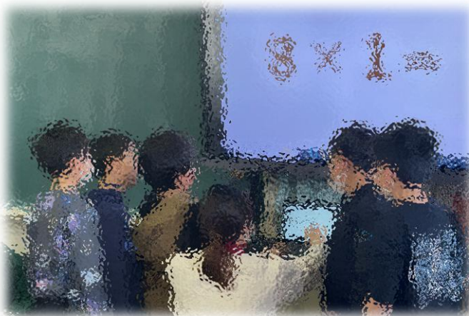
↓音読を発表するグループです