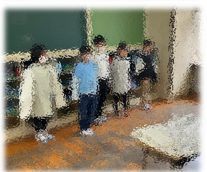
↑音楽を発表するグループです