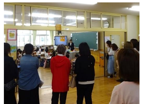
1年生(図工)の授業参観の様子

4月26日（金）、本年度最初の授業参観と育友会総会、学年懇談会を開催しました。何かとお忙しい中だったと思いますが、たくさんのご家族の皆様に来校いただき、授業の様子等を見ていただくとともに、各会にご出席いただきました。ありがとうございました。ところで、授業を受けているお子さんの様子はいかがでしたでしょうか。ちゃんと話を聞いているかな、発表できているのかな等、気になられることも多いと思いますが、本校では、昨年度から、子供たちの学校生活の様子をできるだけたくさん見ていただく機会を作ろうと、オープンスクールの取組を行ってきました。本年度も年3回行いたいと考えています。実施時期が近づきましたら、改めてご案内しますので、是非、機会を見つけてご参観ください。いつもの授業参観とはまた違った雰囲気を感じられると思います。また、今回も含めて、お子さんの様子等で気になられることがあれば、いつでもご連絡ください。