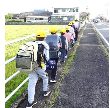
車道から離れて、一列で歩行