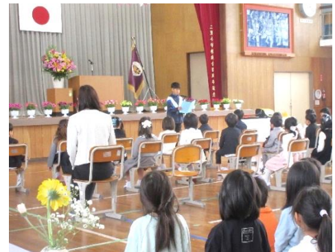
歓迎の言葉を述べる6年代表

12日（金）、さわやかな陽気に包まれた中、本年度の入学式を行いました。ほぼコロナ禍前の従来型の入学式で、子供たちは多くのご来賓の皆様と保護者の皆様に見守られながら、呼名の際はしっかりと返事をして、立派な姿で入学式に臨むことができました。式辞では、本校の校訓である「心きびきび 精一杯」が意味していることについて話したところです。希望と期待に胸を膨らませている