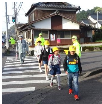
見守り隊の皆様、お世話になります

本校では、各学期の初めに班別登校を行っています。新1年生に歩き方や気を付けるところなどを知らせてもらうこと、見守り隊の方々への挨拶がきちんとできるようになることなどが目的です。二里町は交通量が非常に多いです。1件の事故も起こさないよう、繰り返し声を掛けながら自分で安全を確保できる力を付けさせたいと考えています。また、集団での行動です。集合時刻を守り、揃って登校できるよう気を付けてほしいです。