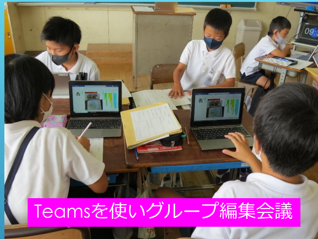
Teamsを使いグループ編集会議