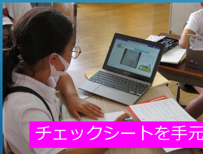
チェックシートを手元に友達の記事をチェック中