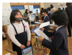
【外国語活動の授業】 (3年生)

9日(木)の午後に、小学校の外国語教育の研究発表会を開催しました。県内から多くの先生が来校され、3年生の外国語活動と5年生の外国語科の公開授業を参観してもらいました。本校では、2年間の研究指定を受け、実践研究をしてきました。その成果の一部を公開しました。多くの先生が参観されている中、3年生も5年生も日頃の授業のように一生懸命学習に取り組んでいました。