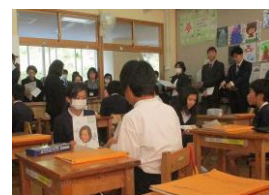
【外国語の授業】 (5年生)