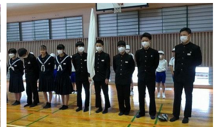
【白団の応援リーダー】