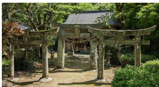
【晴天の中に映える素晴らしいフジでした】【鳥居が3つ並んでいました】