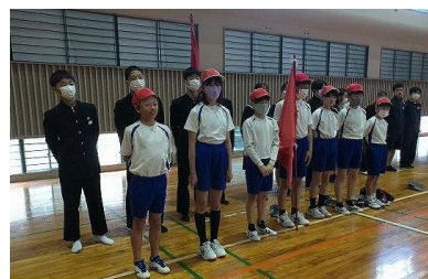
【赤団の応援リーダー】

今週より、21日(日)の体育大会に向けて練習が本格的に始まりました。8日(月)には、赤白の各団に分かれて結団式を行いました。今年度の体育大会は、来賓の方や保護者の方の参観の制限を設けていません。また、「みんなで楽しむことができる種目を取り入れる」という児童生徒会長の公約を実行するために、各クラスから競技種目を募集し、児童生徒会本部役員で選定し、昨年実施していない競技種目を取り入れています。保育園児の参加種目も入れています。体育大会当日の子供たちの頑張りを楽しみにしておいてください。