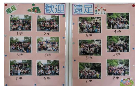
【縦割り班ごとの集合写真】

前児童生徒会長の公約で観音の滝までの遠足が復活したのですが、昨年度は雨天中止となり、今年度は天気に恵まれ実施することができました。