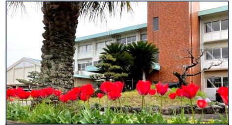
元気に咲いたチューリップが子供たちを出迎えます

予測困難な未来をしなやかに、そして力強く歩んでいける「七浦っ子」を育てるため、今年度も「やる気いっぱい・やさしさいっぱい・元気いっぱい」を合言葉に掲げます。知・徳・体のバランスのとれた成長を支えるには、学校・家庭・地域の連携が欠かせません。お子様の「生きる力」を共に育ていけるよう、今年度も本校の教育活動への温かいご理解とご協力を、どうぞよろしくお願い申し上げます。