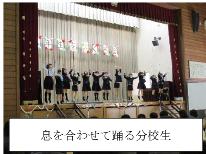
息を合わせて踊る分校生

3月2日に「6年生を送る会」がありました。4年ぶりに体育館で全校児童、保護者様参加で開催しました。児童はステージ発表ということもありとても張り切っていました。どの学年も、精一杯声を出して一生懸命に出し物に取り組んでいました。その姿から6年生に感謝を伝えたい気持ちが伝わってきました。