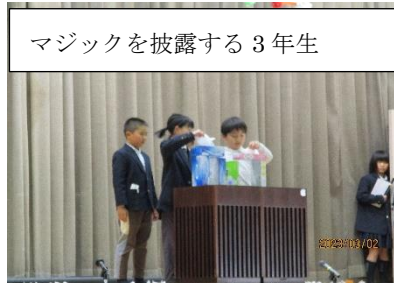
マジックを披露する3年生