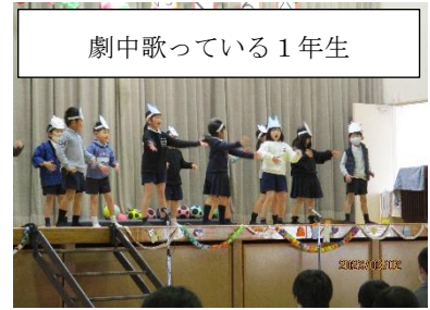
劇中歌っている1年生

3月2日に「6年生を送る会」がありました。4年ぶりに体育館で全校児童、保護者様参加で開催しました。児童はステージ発表ということもありとても張り切っていました。どの学年も、精一杯声を出して一生懸命に出し物に取り組んでいました。その姿から6年生に感謝を伝えたい気持ちが伝わってきました。