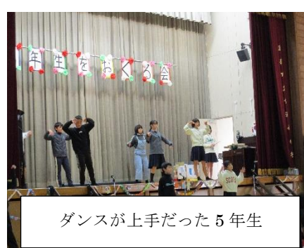
ダンスが上手だった5年生