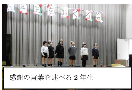
感謝の言葉を述べる2年生