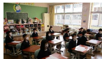
姿勢が美しい1年生

落ち着いて生活しているため、学習に集中できています。そして、子ども同士がぶつかってけがをしたり、ガラスなどを破損させたりすることがありません。素晴らしい子どもたちです。学年末でせわしくなりますが、落ち着いた生活を続けたいと思います。