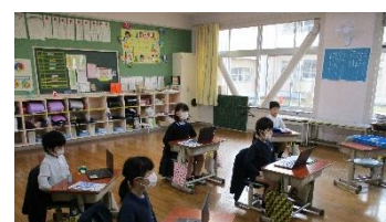
精神を集中させる2年生