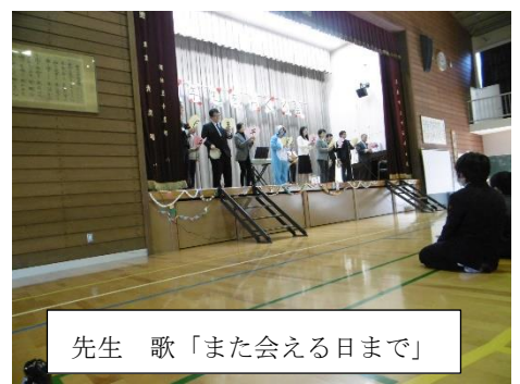
先生 歌「また会える日まで」

また、「6年生を送る会」後の学級懇談会にも参加していただきありがとうございました。