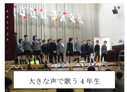
大きな声で歌う4年生

これから卒業式に向けていよいよカウントダウンが始まりますが、6年生と下級生が別れの日まで仲良く楽しく過ごしてほしいと思います。