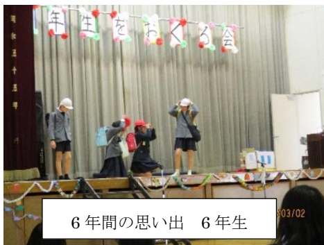
6年間の思い出 6年生

今回は保護者の皆さんにお子さんの頑張っている姿をご覧いただけたことを嬉しく思います。