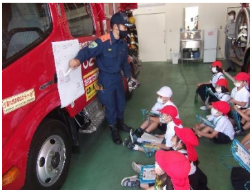
真剣に聞く子どもたち

【1・2年生】5月25日、嬉野方面に行きました。消防署で救助訓練を見ることができました。迫力ある訓練に子どもたちの眼差しも真剣でした。肥前夢街道忍者村の忍者ショーは、参加型ショーで迫力ある太刀回りや笑いを誘うトークにみんなくぎ付けでした。