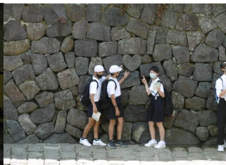
i(アイ)♡(ラブ)見つけたよ