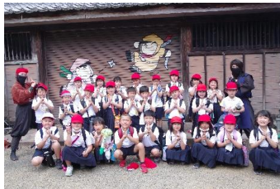
忍者と一緒にハイ！ポーズ