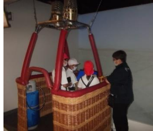
バルーン疑似体験

佐賀県庁の展望ホールから見た佐賀の景色はすばらしいものでした。北には背振山系の山々、南には佐賀平野と有明海を見ることができました。360度途中にささぎるものがなくはるか遠くまで見渡すことができます。佐賀バルーンミュージアムでは、実物大のバスケットに乗りフライトを疑似体験できるフライトシミュレーターに挑戦しました。