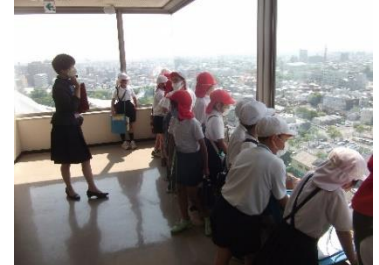
県庁からの眺めは最高

【1・2年生】5月25日、嬉野方面に行きました。消防署で救助訓練を見ることができました。迫力ある訓練に子どもたちの眼差しも真剣でした。肥前夢街道忍者村の忍者ショーは、参加型ショーで迫力ある太刀回りや笑いを誘うトークにみんなくぎ付けでした。