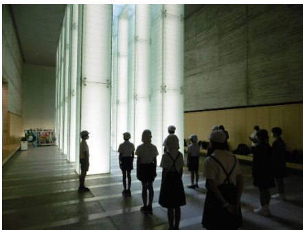
神秘的な空間で平和の集い

【6年生】5月26日から1泊2日で長崎市に修学旅行に行きました。1日目は原爆資料館周辺での平和学習を行いました。語り部（戦争体験者）さんの講話の中で、語り部の質問に子どもたちはハキハキと答えていました。語り部さんも「中学生よりも長崎のことをよく知っている」と驚かれています。2日目は大浦天主堂周辺で歴史の学習をしました。グループでフィールドワークをしながら、西洋文化の玄関口としての役割を長崎が担っていたことを学びました。また、実際に歩きながら坂の町長崎を実感していました。