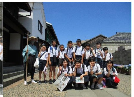
出島で門番の方と記念撮影