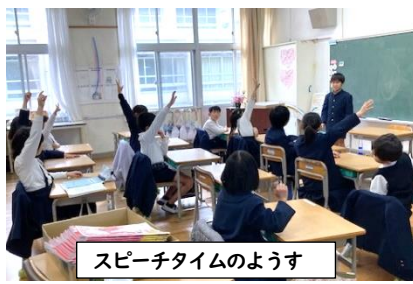
スピーチタイムのようす