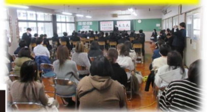
ほぼ満席となった立志式会場

大人でもなく子どもでもない十代半ばのこの時期だからこそ、これまでを振り返り、今を見つめ、「志を立てる」ことは、これから歩むべき未来を展望するためにも意味があるのだと思います。