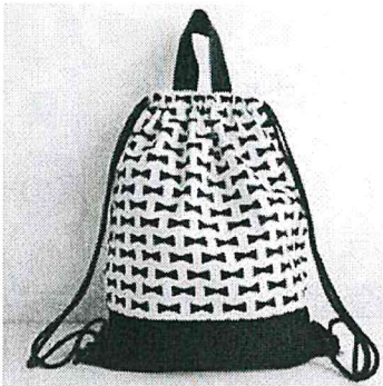
家庭科の学習で作っています。