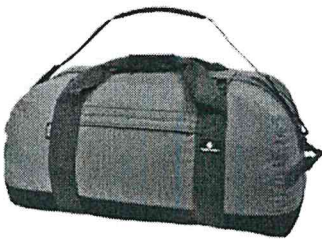
ポストン型・リュック型が好ましいです。