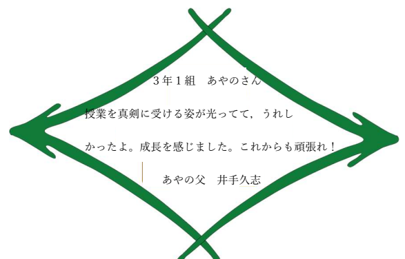
まつばカード 記入例