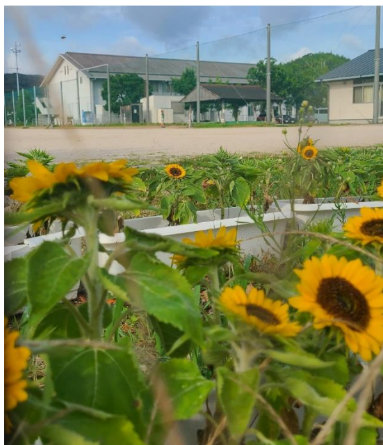
ひまわりがたくさん咲いています