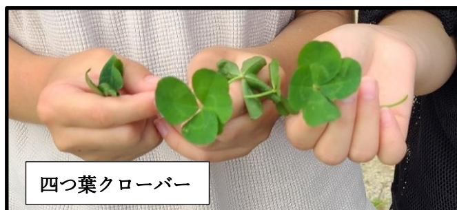
四つ葉クローバー