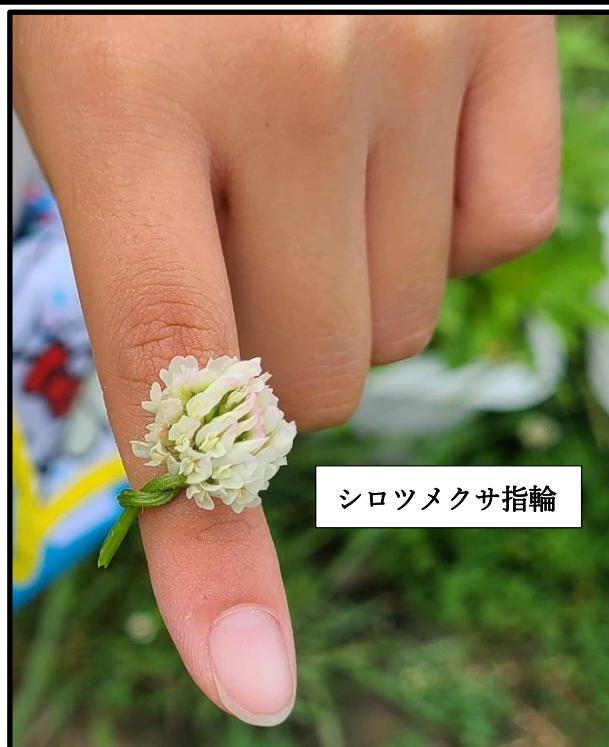
シロツメクサ指輪